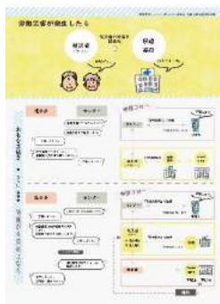
▼周知用の労災手続きフロー

派遣事業で発生した事故に関する労災手続きは、連合会が全ての手続きを行い、申請に遅れが発生しないように体制を整えています。また、損害賠償責任に関する手続きについても同様に対応を行っています。