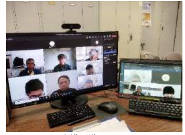
▼オンライン会議の様子

年間計画で行う会議のほかに、各センター事務局職員を対象に、シルバー事業に関する意見交換会を開催。主に情報共有を目的に実施(運営上の課題や、悩み等)